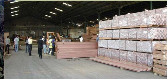
El proceso de fabricación y envío cuidadosamente controlado garantiza la máxima calidad